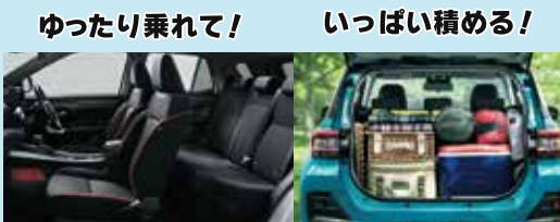
photo:Z ハイブリッド 1.2L 2WD. ボディカラーのシャイニングホワイパールはメーカーオプション33,000円。メーカーオプションは車両本体税込価格に含まれておりません。