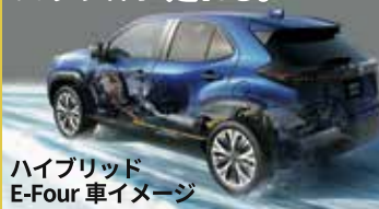
ハイブリッド E-Four 車イメージ

ガソリン車とハイブリッド車。 2つの4WDシステム。 雪道でも安心。スムーズ& パワフルに走れる。